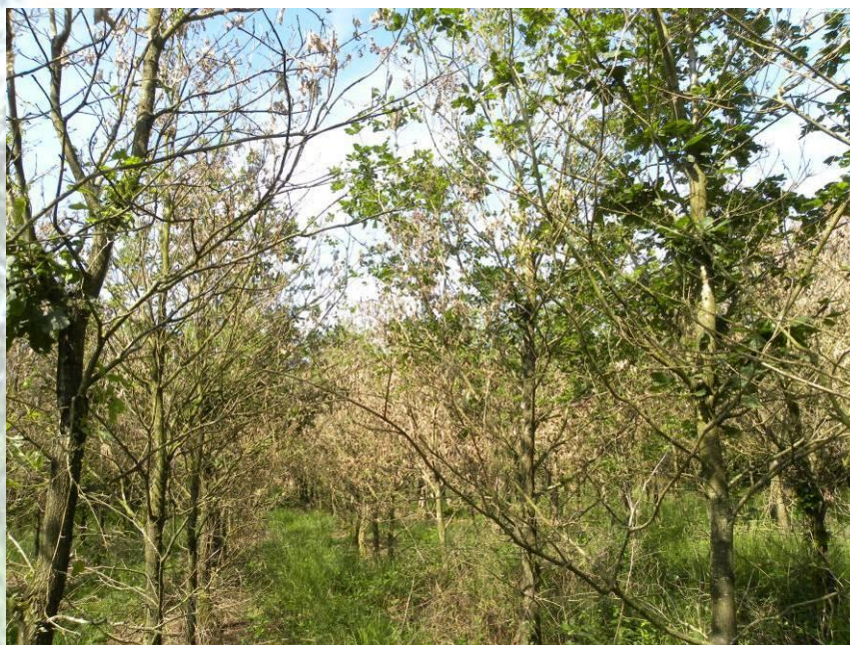
Mortalité de cime dans un perchis de chêne sessile lié à un ennoiement - FD de Sillé le Guillaume (72)

Des plantations en stations à faible écoulement d'eau subissent des problèmes d'ennoiement. Les blessures aux rameaux, provoquées par des orages de grêle, permettent l'installation d'un champignon le sphaeropsis des pins . De forts coups de vent en début d'année provoquent quelques chablis d'arbres isolés. Une courte période chaude et sèche en avril favorise la propagation d'un incendie qui détruit 160 ha de résineux en forêt domaniale de Bercé.