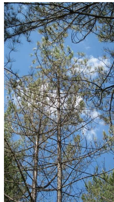
Pin laricio dont les aiguilles ont chuté suite à la maladie des bandes rouges

Si en Loire-Atlantique et en Sarthe, la maladie des bandes rouges affecte légèrement de jeunes boisements de pin maritime, le principal hôte reste de loin le pin laricio de Corse. Il fait l'objet de signalements d'attaque sévère dans les cinq départements. Parfois, les chutes d'aiguilles surviennent dès décembre (Sarthe). L'inquiétude des gestionnaires face à la récurrence et l'ampleur du phénomène et leur questionnement sur la rentabilité des boisements de cette essence, conduisent le DSF, en lien avec la recherche, à mener une étude de trois ans sur les facteurs de vulnérabilité et l'adaptation de la sylviculture. En complément, les correspondants-observateurs effectueront chaque année en plus de mesures de croissance, une notation de l'intensité de l'atteinte des peuplements par la maladie, sur une dizaine de placettes régionales.