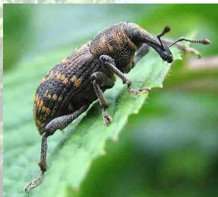
Hylobe adulte 10 mm

Le cycle biologique de ce grand charançon s'effectue sur les souches des pins fraîchement abattus (ponte et développement de l'adulte), sur les jeunes plants (morsures d'alimentation en deux vagues principales au printemps et à la fin de l'été) et dans la litière (hivernation). Quelques jours suffisent pour anéantir un boisement, d'où l'importance d'une détection précoce des dommages.